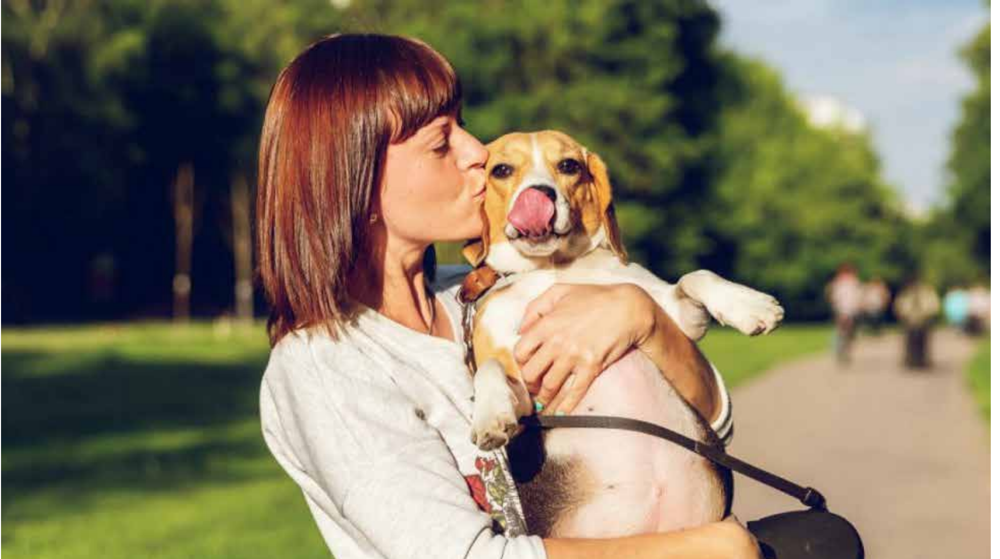
Cariño de un humano a un perro