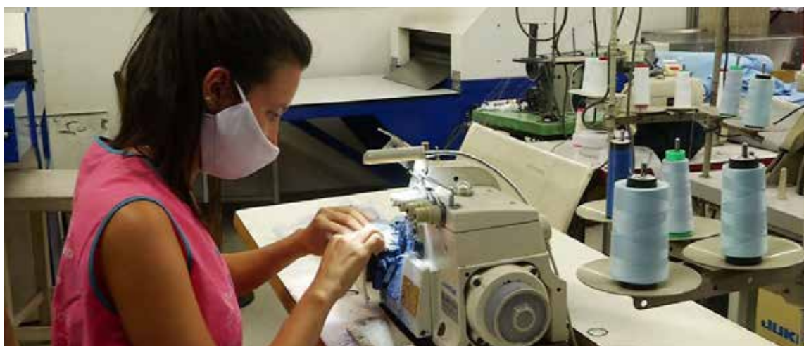
El Estado subsidiará pequeñas empresas o microindustrias de origen hogareño, fruto de la mente ingeniosa de compatriotas que han logrado el establecimiento de sus negocios, dar trabajo al entorno cercano.

Las empresas pequeñas en este renglón de la producción jugarán un papel importante en el desarrollo agrario del país, en re-