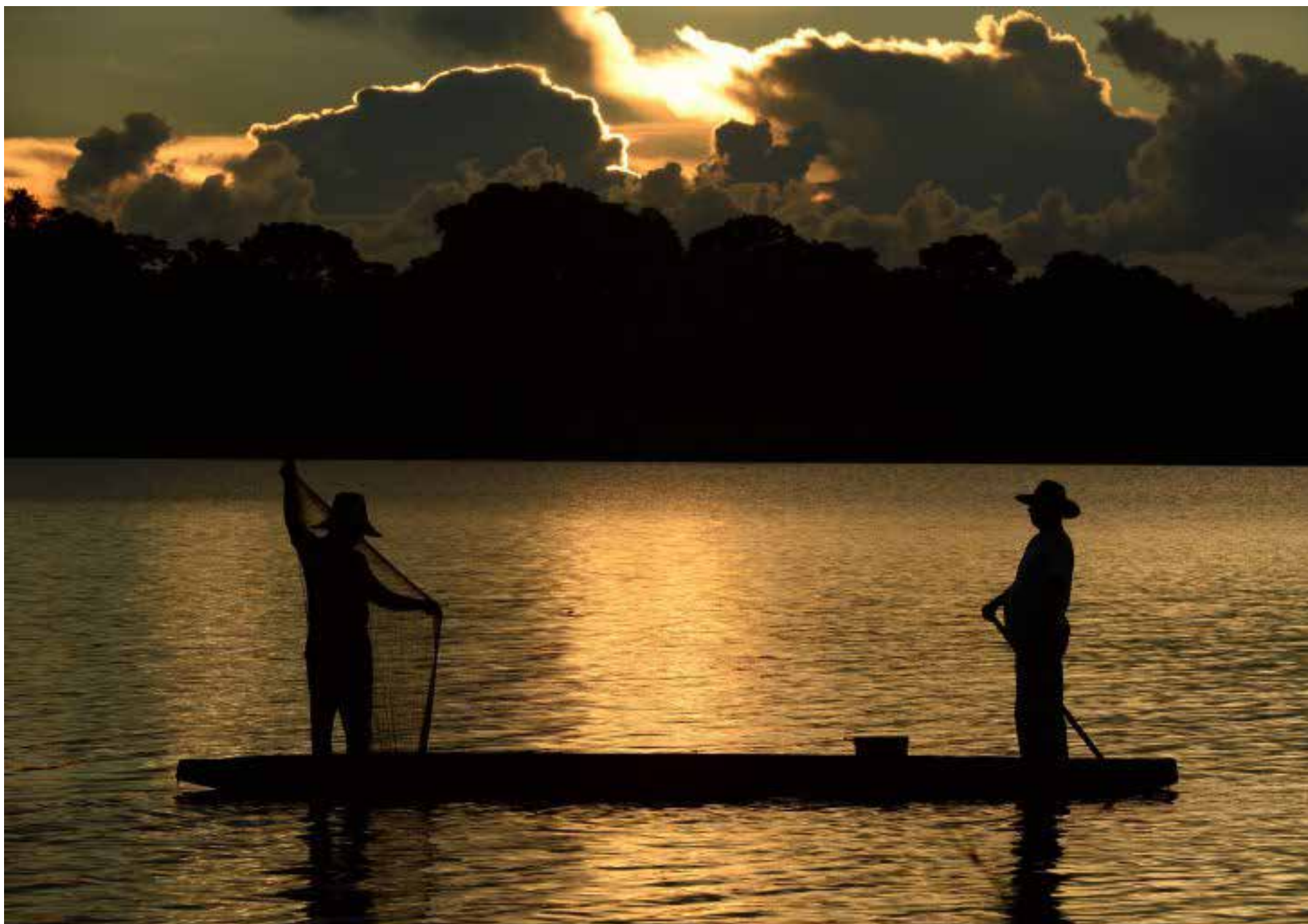
La furia del río Magdalena, la creciente ya ha desbordado su cauce