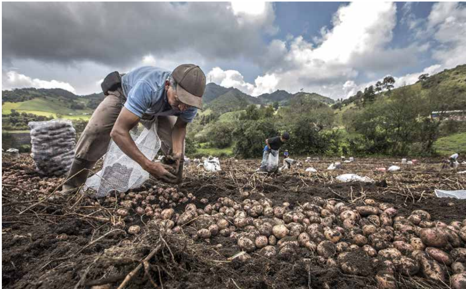
Las microempresas campesinas remedien en parte el problema del desempleo que afecta a familias en Colombia.