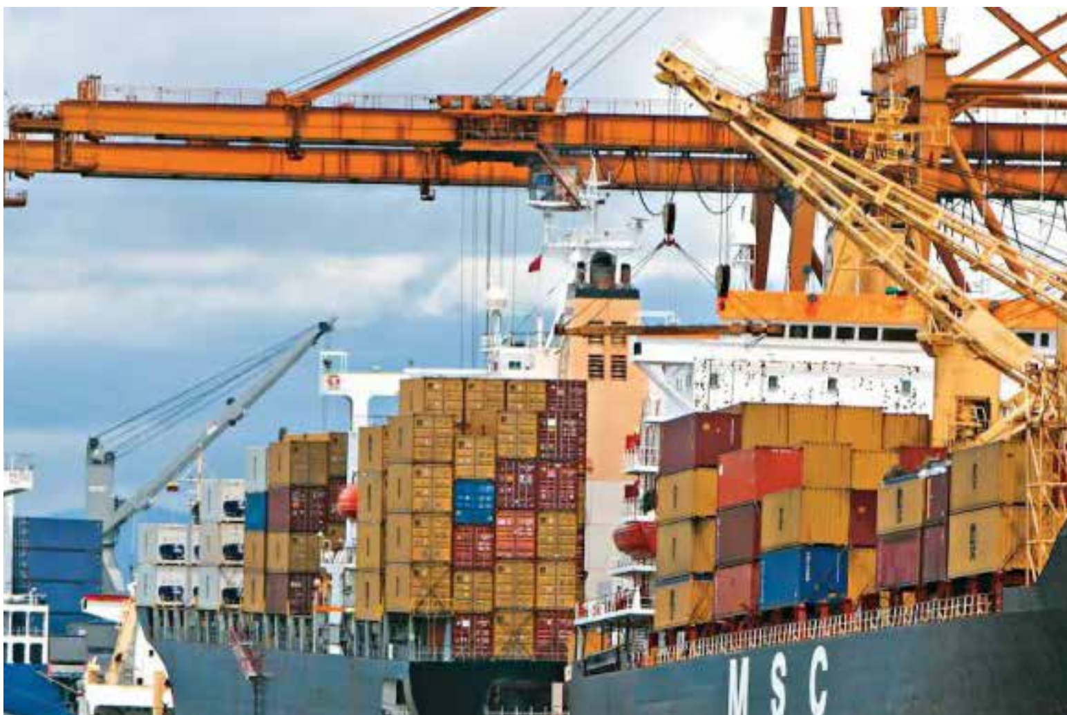
El presidente Petro advirtió que el narcotráfico opera casi en la totalidad de los puertos colombianos para el envío de drogas al exterior, mientras que los buques regresan cargados de contrabando, contribuye al aumento de la violencia en las ciudades portuarias del país.

«Los puertos deben tener radicalmente otra administración, porque han sido cooptados por narcotraficantes y su otra cara, que son los contrabandistas. Esta acción tiene que desplegarse