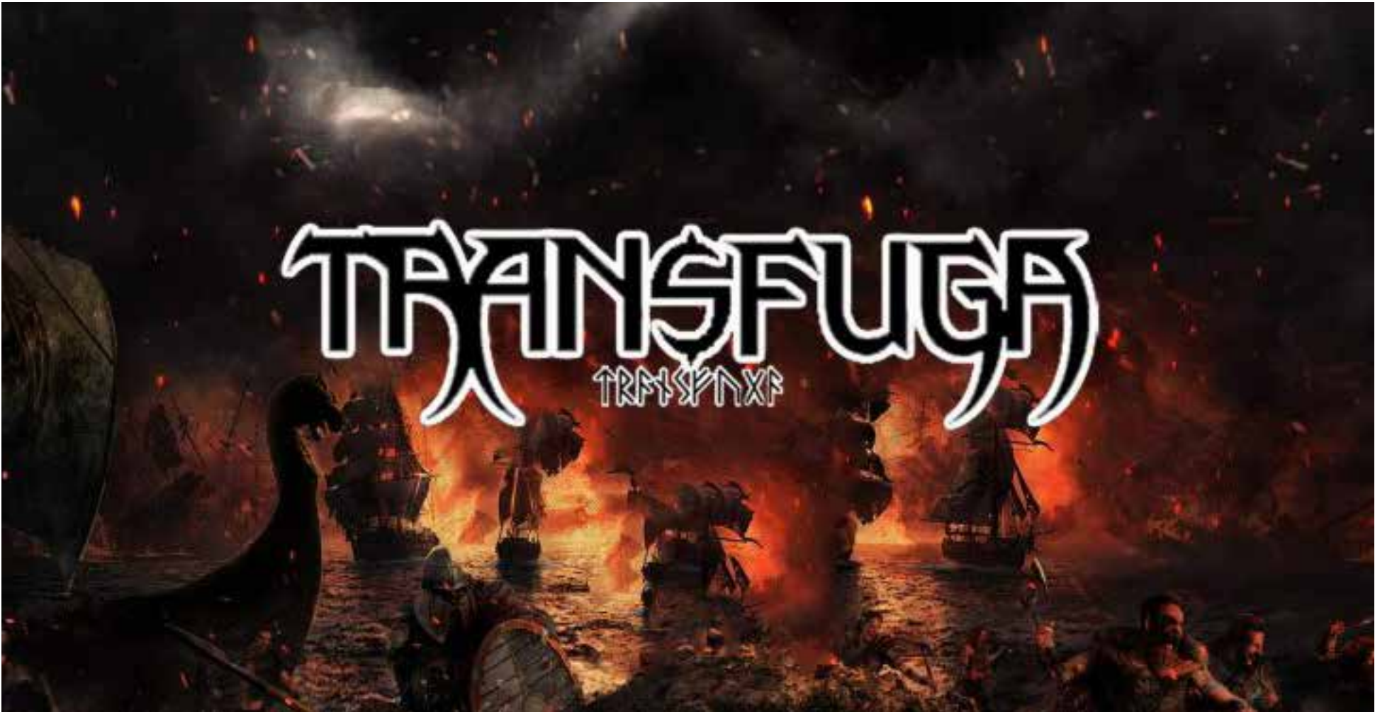
Se hundieron los tránsfugas en el Congreso de Colombia

¡No Pasó! 55 Votos Sientan un Precedente Contra el Transfuguismo: