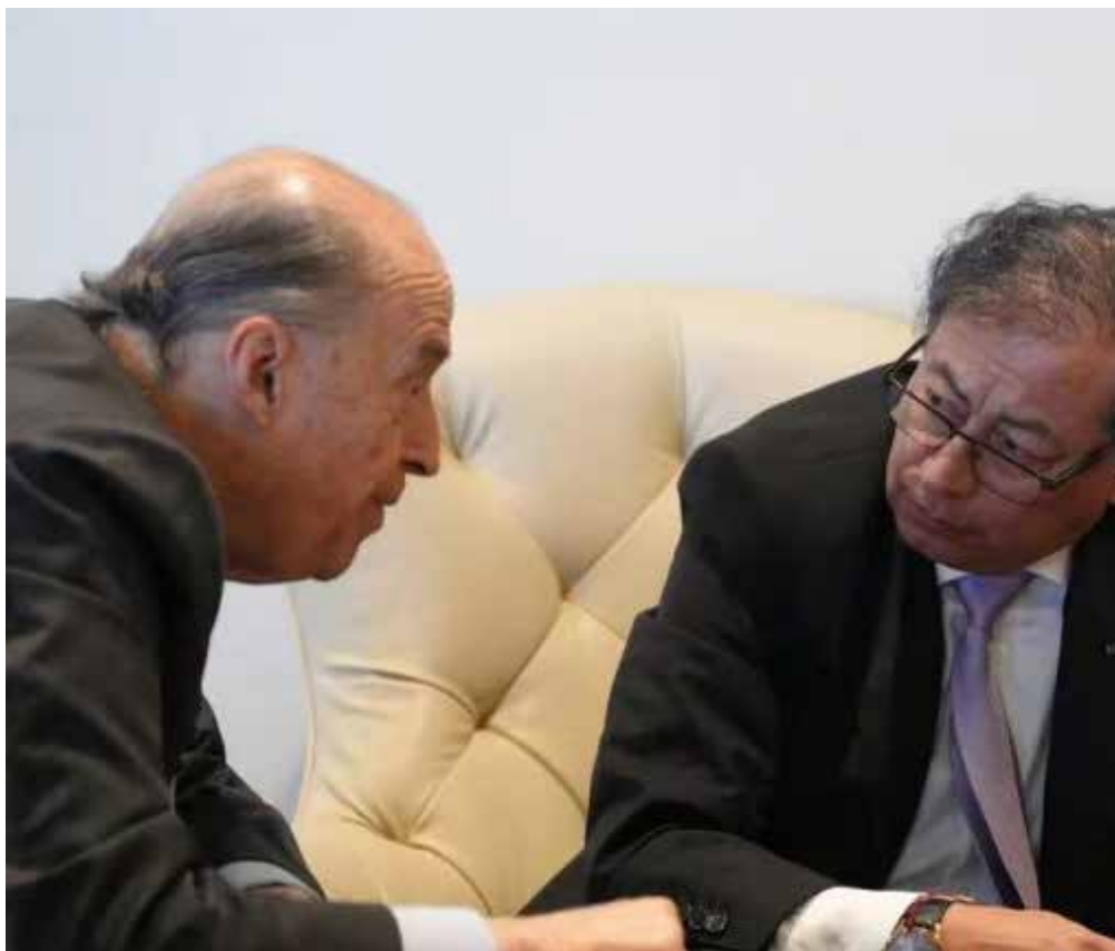
El presidente Petro hablando con su ex amigo Alvaro Leyva Durán

Aunque el mandatario no ha presentado pruebas concretas que respalden sus acusaciones, la gravedad de las mismas ha generado una ola de reacciones en el ámbito político y mediático. La denuncia ha sido interpretada por algunos sectores como un intento