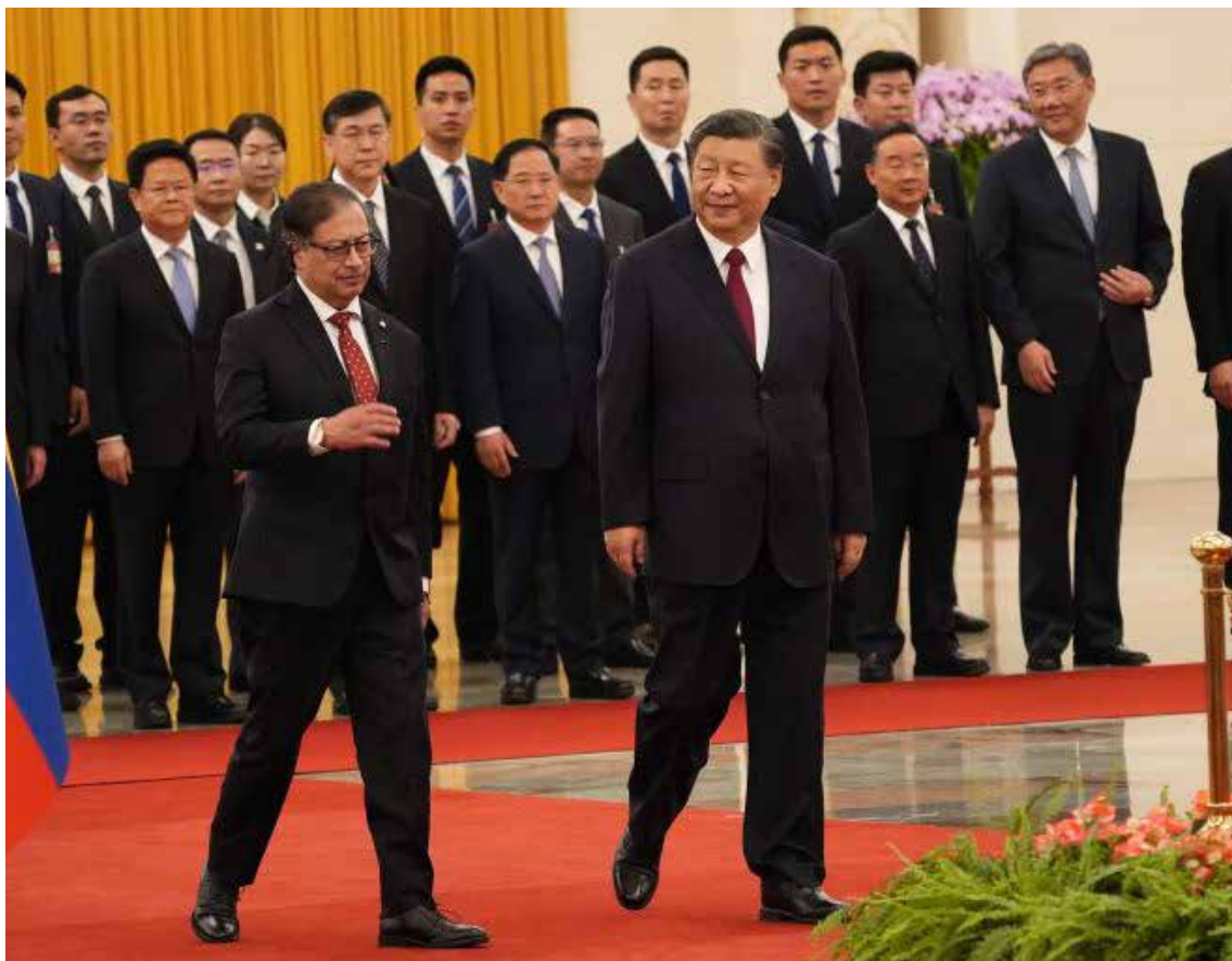
Petro dejó claro que su visita al presidente de China, Xi Jinping, en calidad de presidente de Colombia y de la CELAC, será un diálogo de «tú a tú», sin «arrodillarse» ante la potencia asiática.

Petro defendió la soberanía de Colombia para establecer relaciones comerciales con quien considere conveniente, cuestionando las críticas a su acercamiento a China. «¿Qué daño nos ha hecho China? ¿Acaso nos ha invadido, nos qui-