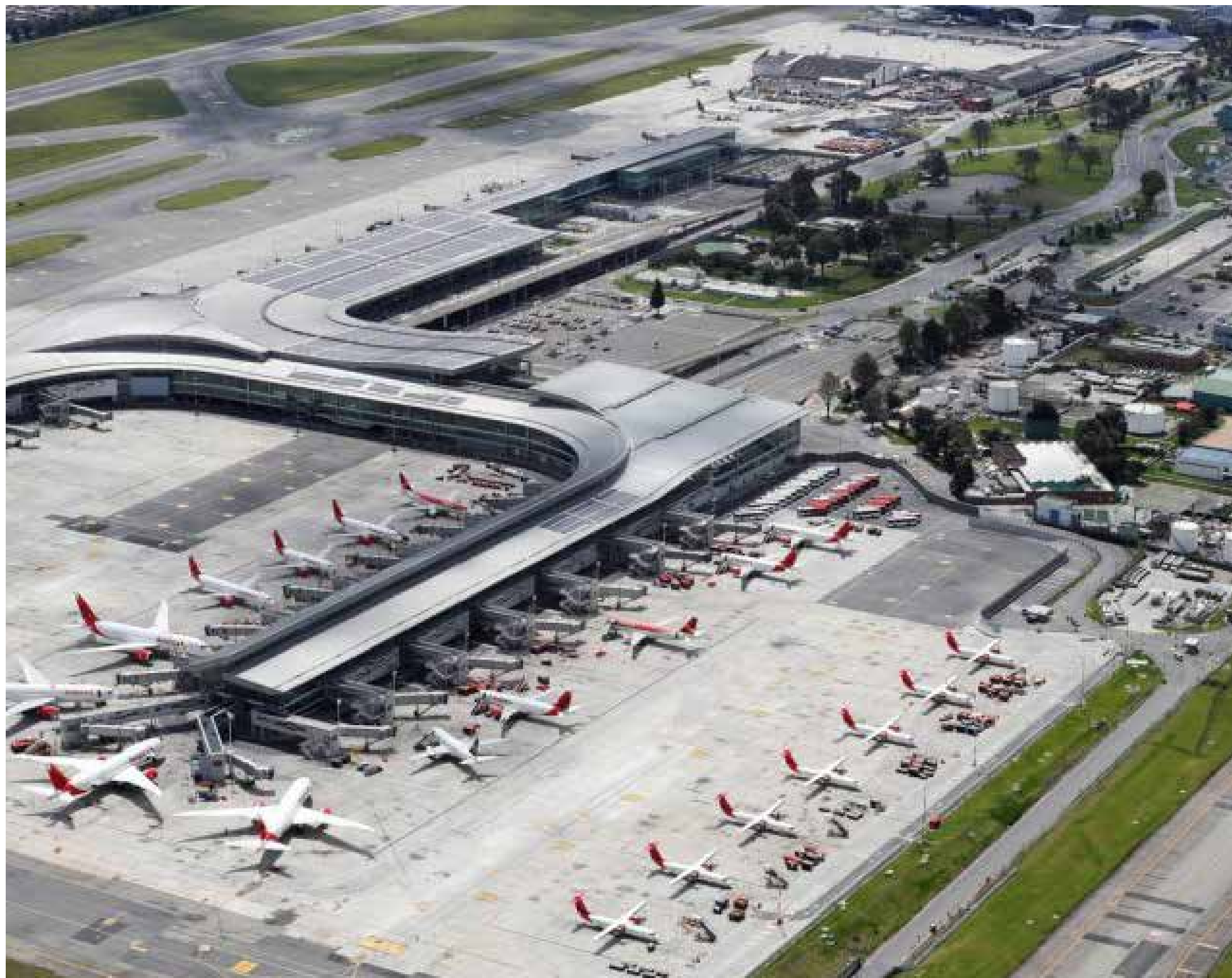
El presidente Petro solicitó una revisión exhaustiva de los contratos en el aeropuerto El Dorado, sugiriendo una posible conexión entre el aumento de homicidios en Bogotá y actividades ilícitas que operan a través de la terminal aérea.

Fiscal y Aduanera) y con la DIAN, me parece que haN fracasado», aseveró, anticipando cambios significativos en los organismos encargados de la vigilancia y el control aduanero en el país.