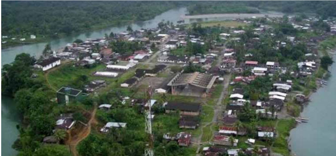
López de Micay

E l presidente Gustavo Petro demandó a su gabinete intensificar la presencia y gestión del Gobierno nacional en territorios históricamente excluidos y azotados por la violencia, con énfasis en regiones críticas como el Micay y el Catatumbo.