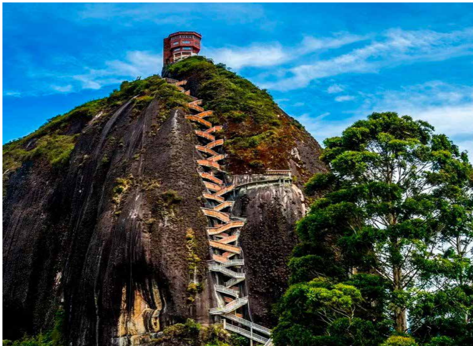
El Peñón de Guatapé a un monolito de 220 metros de altura localizado en el municipio que lleva su nombre .