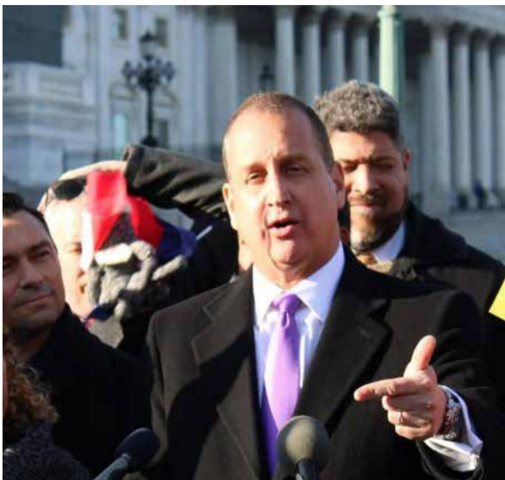
El presidente Petro afirmó que el congresista de Estados Unidos, Mario Díaz-Balart, de organizar las reuniones donde se está organizando ese complot.

de Petro por desviar la atención de las investigaciones que se adelantan en su contra, mientras que otros la consideran una señal de alerta sobre posibles intentos de desestabilización de su gobierno.