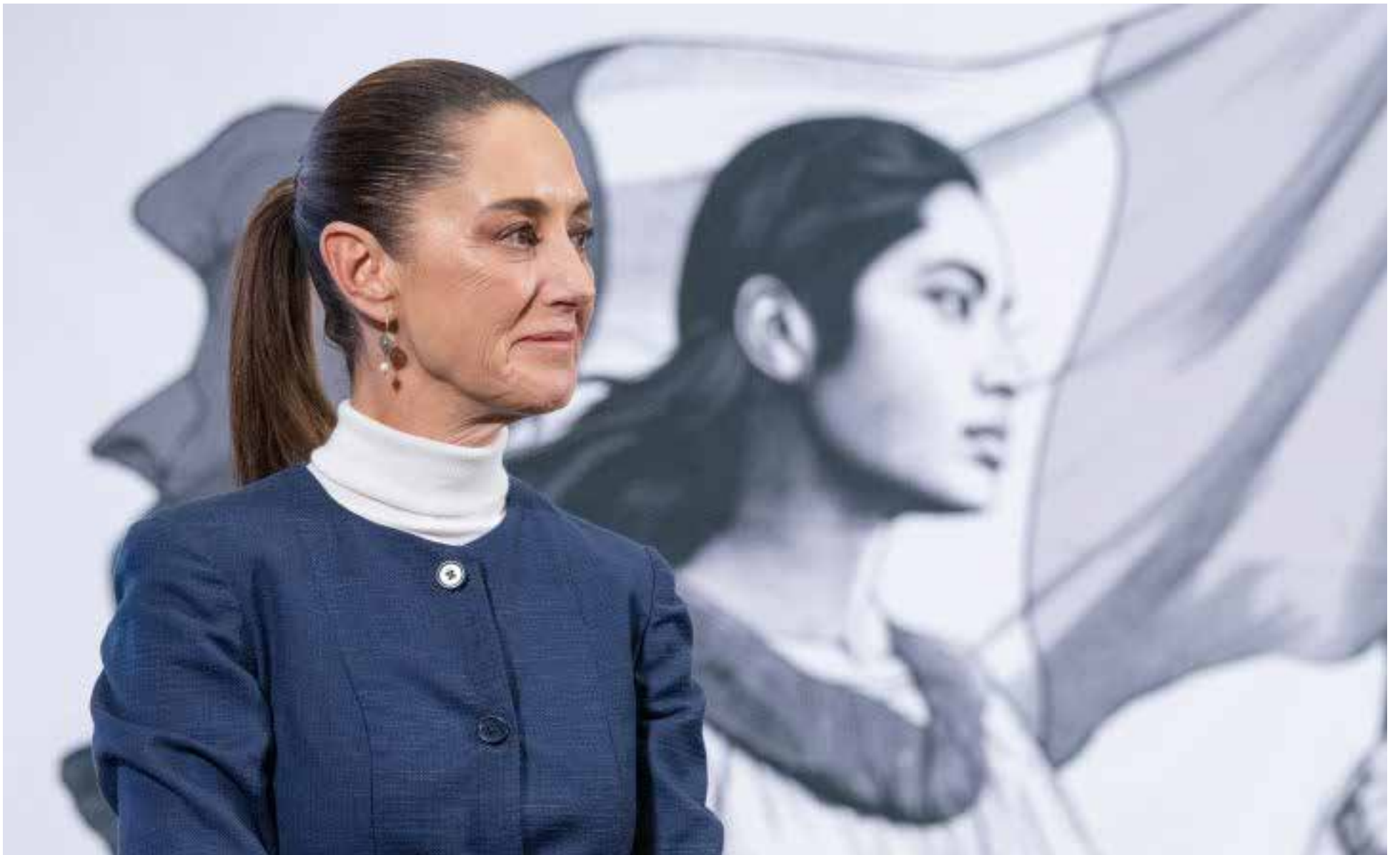
Claudia Sheinbaum Pardo, presidenta de México

C laudia Sheinbaum Pardo, la primera mujer en alcanzar la presidencia de México, se ha convertido en un símbolo poderoso del liderazgo femenino, demostrando que su impacto trasciende fronteras y redefine el panorama político y social. Ingeniera, académica y política, Sheinbaum ha dedicado su vida a la lucha por la justicia social, la igualdad y el desarrollo sosteni-