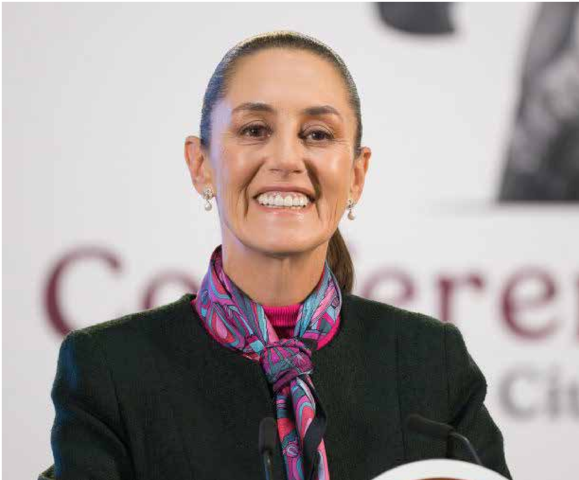
Claudia Sheinbaum Pardo, la primera mujer en alcanzar la presidencia de México, se ha convertido en un símbolo poderoso del liderazgo femenino, demostrando que su impacto trasciende fronteras.

el crecimiento económico y la innovación.